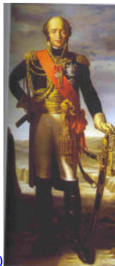
C in C General Davout (bueno)

Pero veamos antes con que fuerzas contaba Davout.