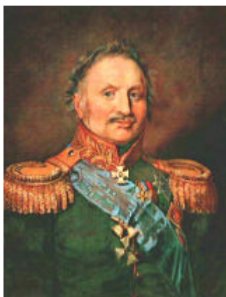
General de ala Wittensgtein