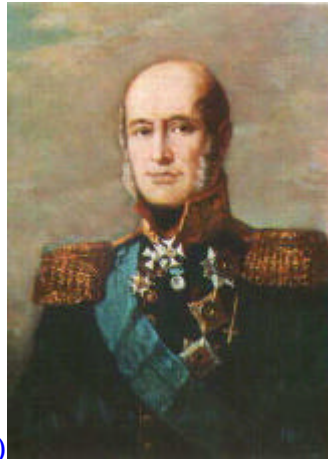
C in C General Barclay de Tolly (bueno)