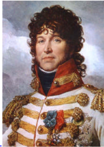
Jefe de Ala, General Murat.