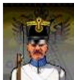
4 brigadas de infanteria 5SP-Sk1