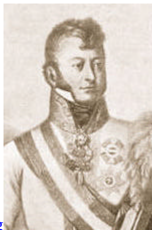
Jefe de Ala General Schwarzenberg