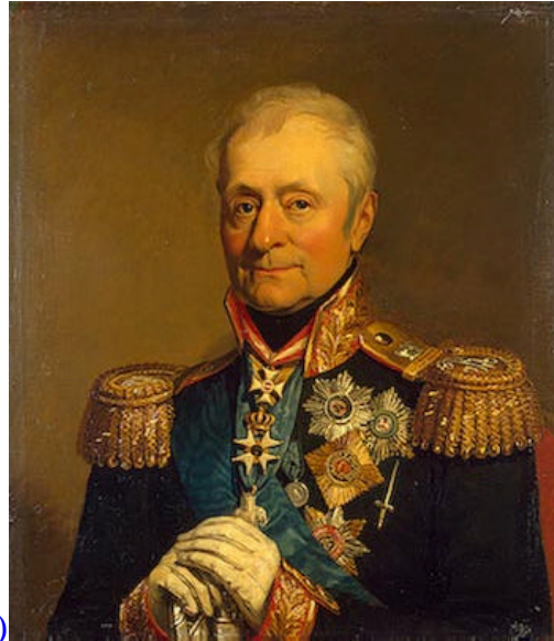
C in C General Bennigsen

vados a mi derecha. Me dispuse a desplegar a Bennigsen con sus 35mil hombres.